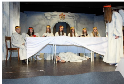
In da himmlischen Engelwerkstatt