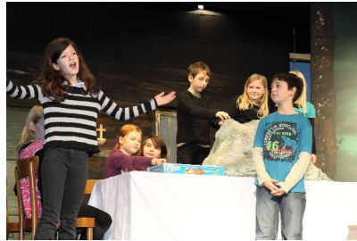
Ja mei, so is's halt im Kindertheater