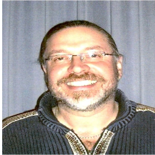
So is er dann aussikemma