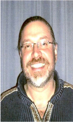
So is unsa Vorstand einiganga